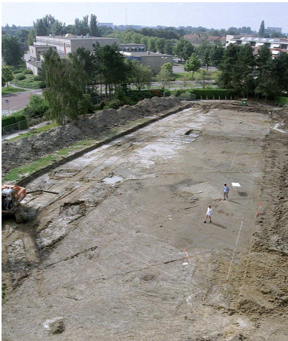
Afbeelding 1 Overzicht put, opgraving Verpleeghuis Ter Valcke in 2002, kijkend naar het zuidwesten.

Het gemeentearchief van Goes inventariseert het cultureel erfgoed in de stad Goes en omliggende dorpen waarbij naast gebouwen ook elementen als gevelstenen, stoepalen, hekken, levensbomen, muurankers ed. op de foto worden gezet en nauwgezet beschreven. Deze inventarisatie heeft als doel het cultureel erfgoed in de gemeente Goes te beschermen en te behouden. In de Cultuurnota 2008-2011 (december 2008) wordt met betrekking tot het cultureel erfgoed gemeld dat ook monumentenzorg, archeologie en het gemeentelijk archief feitelijk onder cultureel erfgoed vallen, maar dat deze vanwege hun specifieke karakter in de nota buiten beschouwing worden gelaten. Voor genoemde beleidsterreinen zijn aparte beleidsnotities in